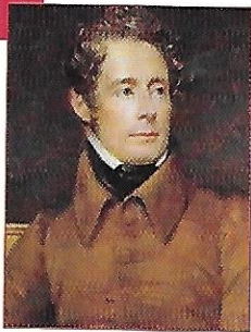
Alphonse DE LAMARTINE (1790-1869)