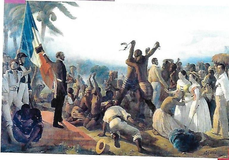
François Auguste BIARD, L'abolition de l'esclavage dans les colonies françaises en 1848, 1849 , huile sur toile, 260 cm x 392 cm, musée national du château de Versailles.